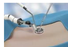
CIRUGÍA MÍNIMAMENTE INVASIVA. LAPAROSCOPIA