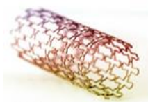
CATÉTERES Y STENTS